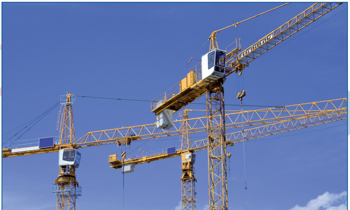
Neben der Veränderung des Wohnungsbestands wird auch der Modernisierungsbedarf aufgezeigt.