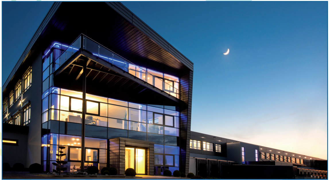
Ausgezeichnet mit dem 4. Platz im Mittelstandsranking von Wirtschaftswoche und Deutscher Bank.

Ein bis zwei Stunden nach Hamburg, Mitteldeutschland oder ins Ruhrgebiet: Zentral im Nordwesten gelegen, bietet der Landkreis Osnabrück mit drei Autobahnen, einem Eisenbahnkreuz, der Kanalbindung und dem internationalen Flughafen beste Verbindungen. Im Umkreis von 200 Kilometern erschließt sich so ein Konsumpotenzial von über 46 Millionen Menschen. Als viertstärkste Mittelstandsregion Deutschlands finden sich vor Ort zahlreiche Marktführer und Hidden Champions.