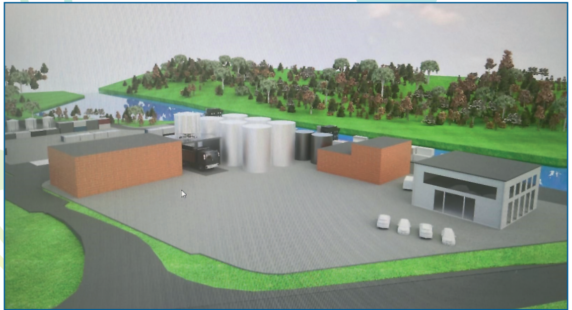
Visualisierung Hafen Wittlager Land in Bohmte.

Die effiziente, leistungsfähige Transportalternative wird unsere Straßen erheblich entlasten. Das Potential über die Wasserstraße Kosten sowie CO2 einzusparen, Terminalsicherheit in den Lieferketten zu gewährleisten, eine dauerhafte, zukunftssichere und klimafreundliche Logistikköslung für die Warenbeschaffung und die Optimierung der Transportwege ins Umland zu bieten, ist enorm. Direkt an den Hafen schließt ein Gewerbe- und Industriegebiet an. Hier liegt der Fokus vorrangig auf der Schaffung eines nachhaltigen, Klimaschutzfreundlichen Gewerbegebietes für hafenaflne Unternehmen.