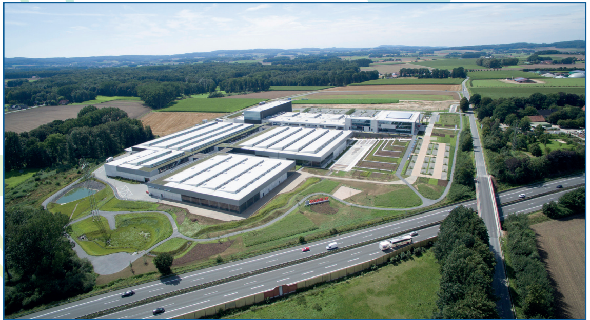
Marktführer unterschiedlichster Branchen haben ihren Sitz bzw. Standorte im Landkreis Osnabrück.

Ernährungswirtschaft, Lebensmittel- und Agrartechnik sowie Logistik: Mit Clusterförderern wie dem Agrotech Valley und dem Deutschen Institut für Lebensmitteltechnik zeichnet sich das Osnabrücker Land als Zukunftsstandort für die Agrar- und Ernährungsbranche aus. Auch im Bereich Logistik ist die Region mit einer guten Anbindung, dem Hafen Wittlager Land sowie den gemeinsamen Forschungsprojekten Logist.Plus und Klima.Logis gut aufgestellt. Der Mehrwert wird zudem um Innovationen aus Universität, Hochschule und Kompetenzzentren ergänzt.